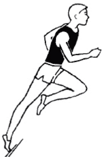
Бег по дистанции