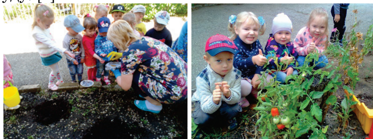
(труд на нашем огороде)

задач экологического воспитания большое значение имеет природное окружение в детском саду. Это уголки природы, организация систематических наблюдений за природными явлениями объектами приобщение детей к регулярному труду. [1]