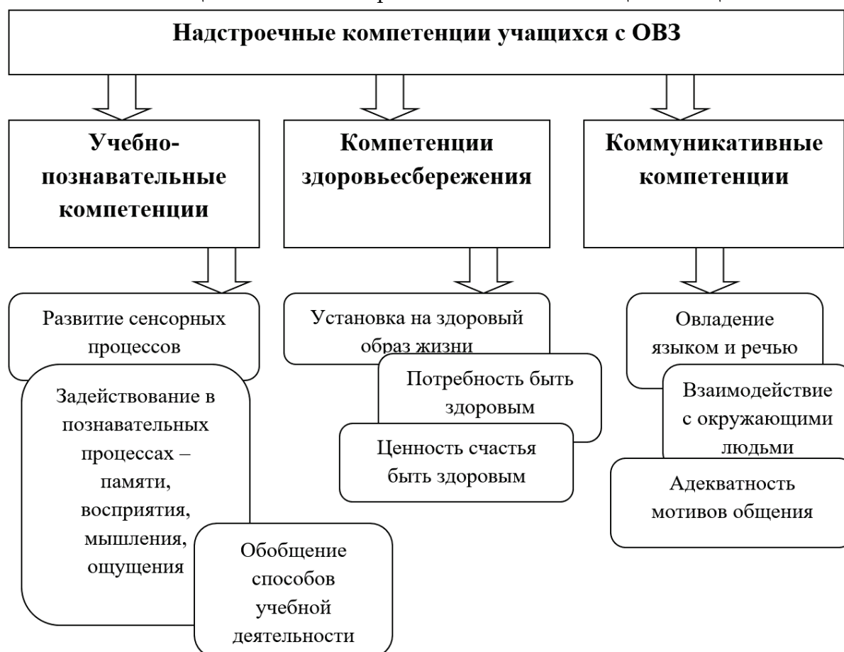
Рис. 2. Надстроечные компетенции учащихся с ОВЗ

Компетенции личностного самосовершенствования заключаются в способности детей с ОВЗ к физическому, духовному и интеллектуальному саморазвитию, эмоциональной саморегуляции и самоподдержки, культуре мышления и поведения; в половой грамотности, экологическом мировоззрении; овладение способами самостоятельного и независимого существования, созданию собственной жизни на духовно-нравственных основах. По словам автора фундаментальных работ по психологии, дефектологии и психиатрии Л.С. Выготского - «развитие внутренних индивидуальных свойств личности ребенка имеет ближайшим источником его сотрудничество с другими людьми», что подразумевает весь спектр человеческих отношений, протекающий в рамках определенной культуры, которые, возникая в каждый момент жизни ребенка, вносят свой вклад в развитие его как личности. Здесь мы можем утверждать, что компетенция личностного самосовершенствования отталкивается от коммуникативной компетенции и является прямым источником социализации человека.