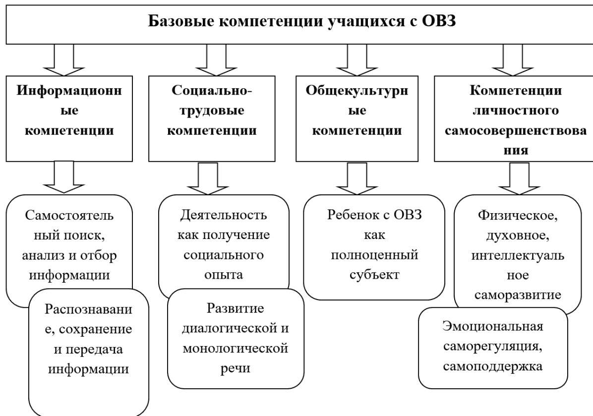
Рис. 1. Базовые компетенции учащихся с ОВЗ

физического развития; основываются на двух компонентах: развитие системно-информационной картины мира и информационно-технологической компетенции.